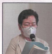
・汐見台地区青少年指導員協議会 ・汐見台地区民生委員児童委員協議会 ・汐見台地区環境事業推進委員会